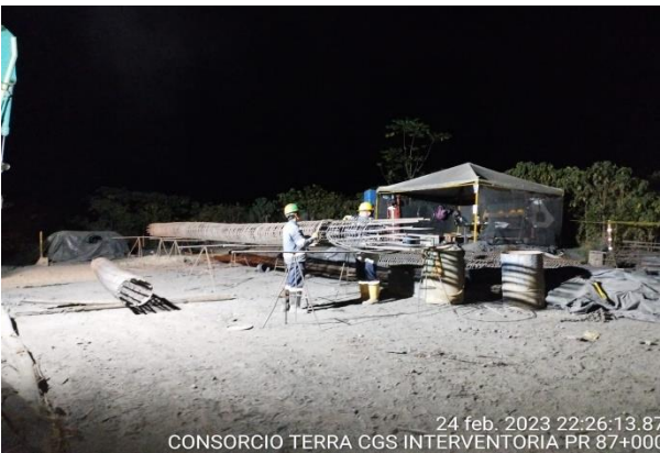
24 feb. 2023 22:26:13.87 CONSORCIO TERRA CGS INTERVENTORIA PR 87+000