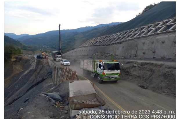
sábado, 25 de febrero de 2023 4:48 p. m. CONSORCIO TERRA CGS PR87+000

PR87+0000 Caída de banca, Vía Sogamoso – Aguazul 25 de febrero de 2023 Monitoreo: CDGRD, CMGRD, Bomberos y Policía de Pajarito, Contratista Consorcio Vial MHC 056, Interventoría Consorcio Terra CGS