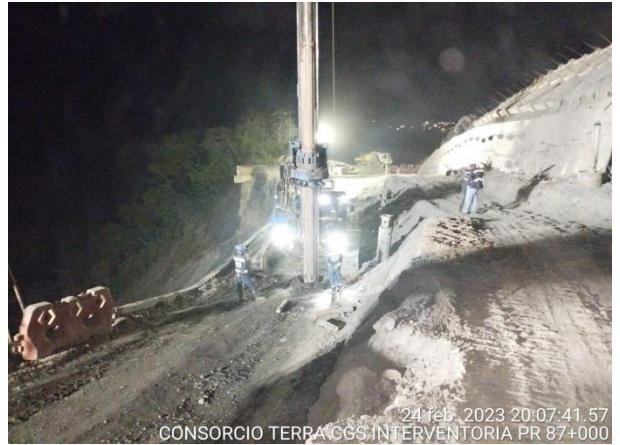
24 feb. 2023 20:07:41.57 CONSORCIO TERRA CGS INTERVENTORIA PR 87+000