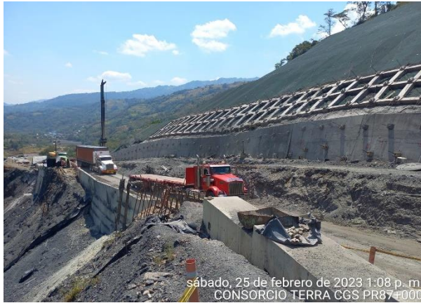
sábado, 25 de febrero de 2023 1:08 p. m. CONSORCIO TERRA CGS PR87+000