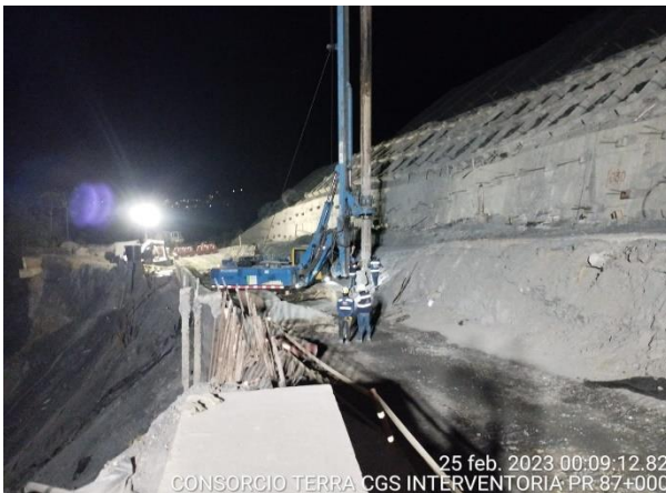
25 feb. 2023 00:09:12.82 CONSORCIO TERRA CGS INTERVENTORIA PR 87+000