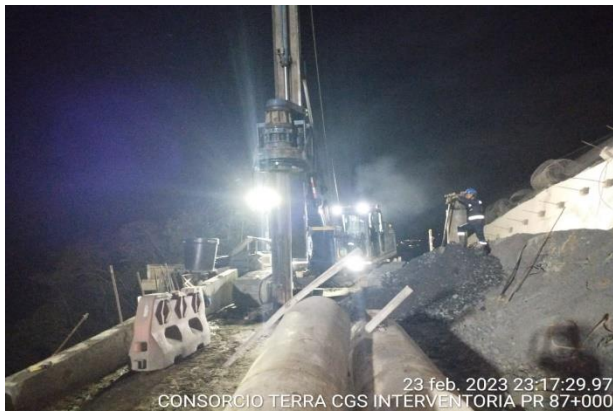
23 feb. 2023 23:17:29.97 CONSORCIO TERRA CGS INTERVENTORIA PR 87+000