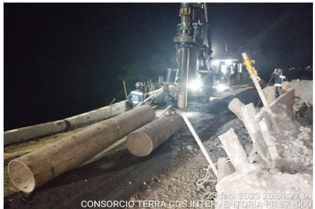
23 feb. 2023 20:51:27.61 CONSORCIO TERRA CGS INTERVENTORIA PR 87+000

PR87+0000 Caída de banca, Vía Sogamoso – Aguazul 24 de febrero de 2023