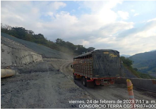
viernes, 24 de febrero de 2023 7:11 a. m. CONSORCIO TERRA CGS PR87+000