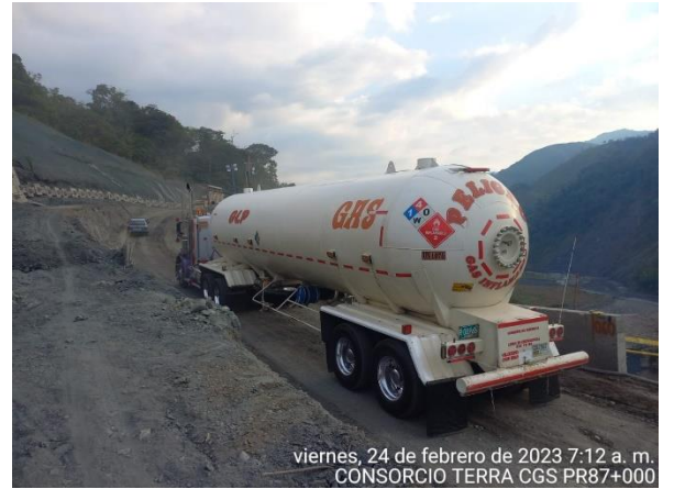
viernes, 24 de febrero de 2023 7:12 a. m. CONSORCIO TERRA CGS PR87+000