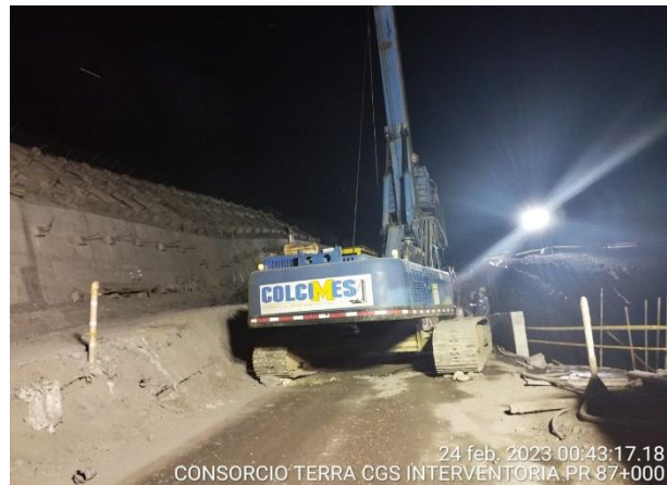
24 feb. 2023 00:43:17.18 CONSORCIO TERRA CGS INTERVENTORIA PR 87+000