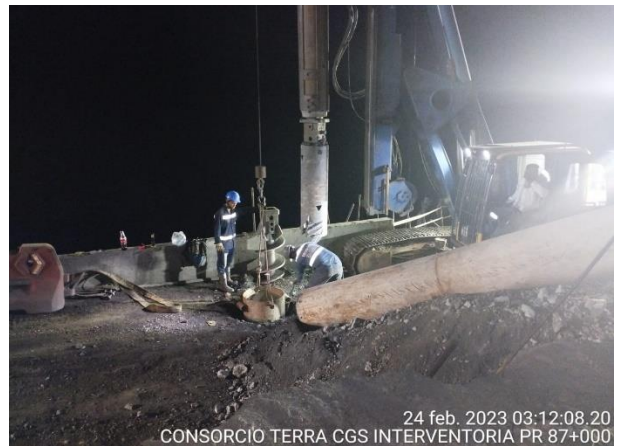
24 feb. 2023 03:12:08.20 CONSORCIO TERRA CGS INTERVENTORIA PR 87+000