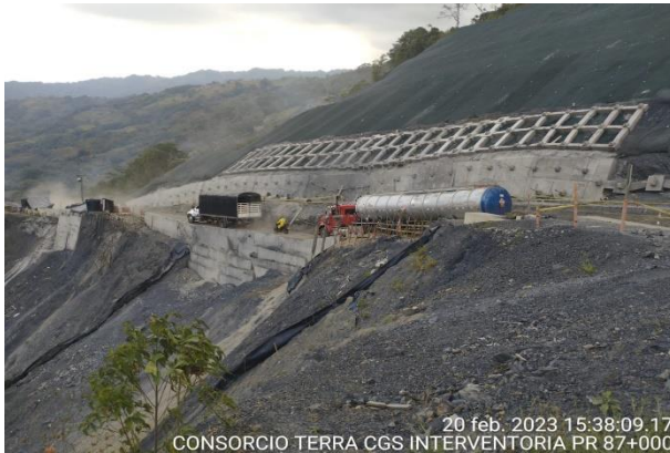
20 feb. 2023 15:38:09.17 CONSORCIO TERRA CGS INTERVENTORIA PR 87+000