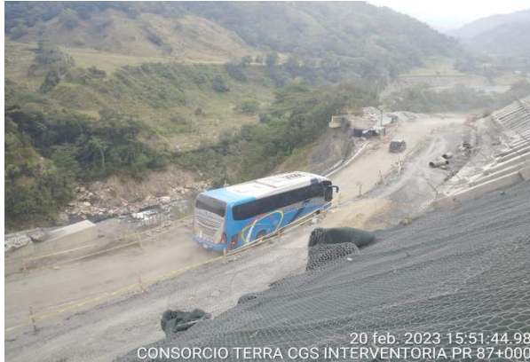
20 feb. 2023 15:51:44.98 CONSORCIO TERRA CGS INTERVENTORIA PR 87+000