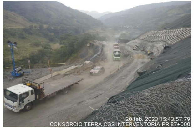
20 feb. 2023 15:43:57.79 CONSORCIO TERRA CGS INTERVENTORIA PR 87+000