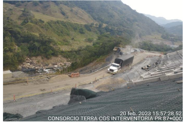
20 feb. 2023 15:57:28.52 CONSORCIO TERRA CGS INTERVENTORIA PR 87+000

PR87+0000 Caída de banca, Vía Sogamoso – Aguazul 20 de febrero de 2023