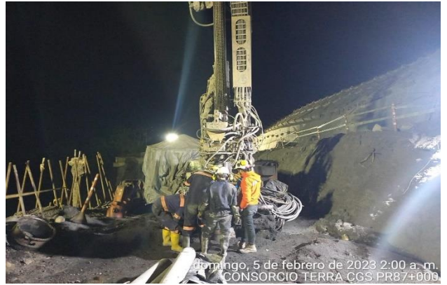
domingo, 5 de febrero de 2023 2:00 a. m. CONSORCIO TERRA CGS PR87+000