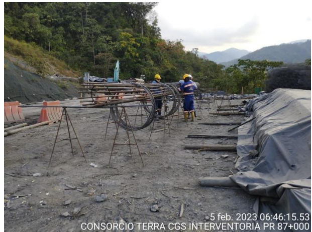
5 feb. 2023 06:46:15.53 CONSORCIO TERRA CGS INTERVENTORIA PR 87+000