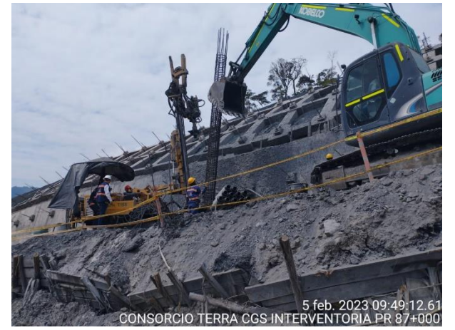
5 feb. 2023 09:49:12.61 CONSORCIO TERRA CGS INTERVENTORIA PR 87+000