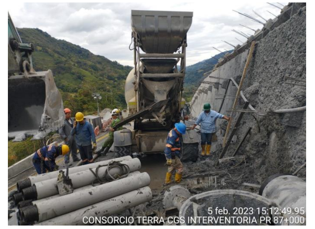
5 feb. 2023 15:12:49.95 CONSORCIO TERRA CGS INTERVENTORIA PR 87+000

PR87+0000 Caída de banca, Vía Sogamoso – Aguazul 05 de febrero de 2023 Monitoreo: CDGRD, CMGRD, Bomberos y Policía de Pajarito, Contratista Consorcio Vial MHC 056, Interventoría Consorcio Terra CGS