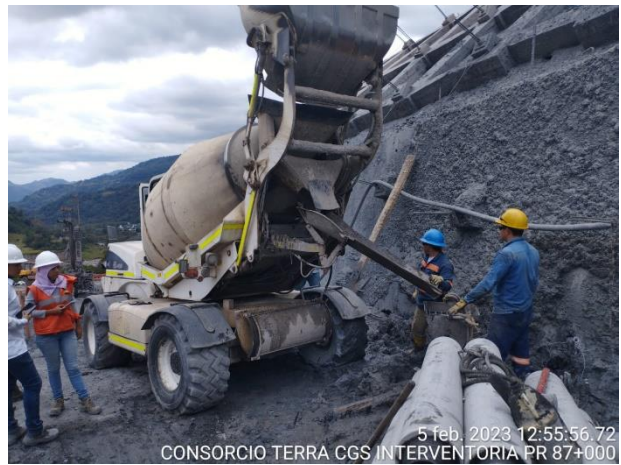
5 feb. 2023 12:55:56.72 CONSORCIO TERRA CGS INTERVENTORIA PR 87+000