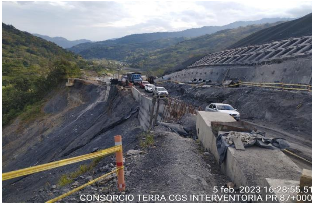
5 feb. 2023 16:28:55.51 CONSORCIO TERRA CGS INTERVENTORIA PR 87+000