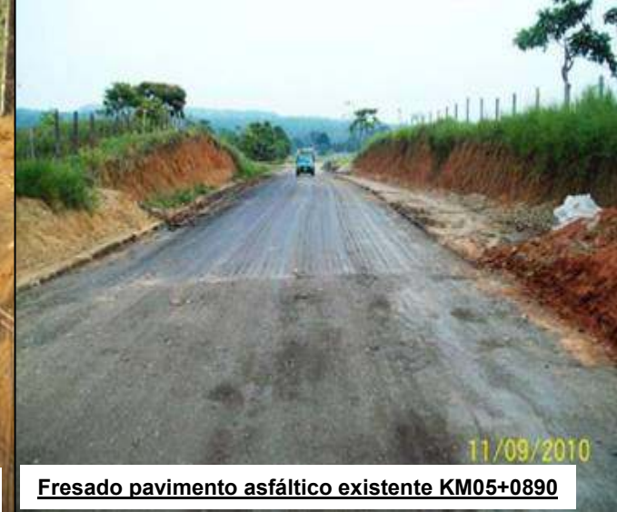
Fresado pavimento asfáltico existente KM05+0890