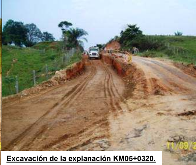
Excavación de la explanación KM05+0320.