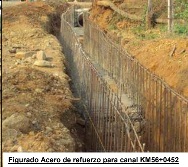
Figurado Acero de refuerzo para canal KM56+0452