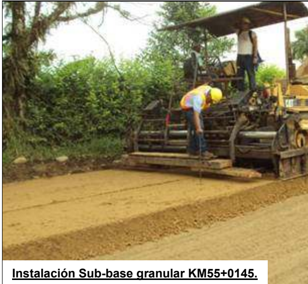
Instalación Sub-base granular KM55+0145.