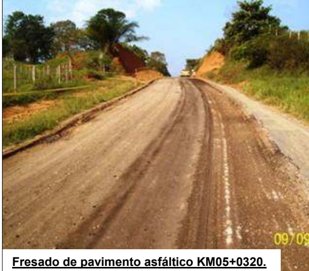
Fresado de pavimento asfáltico KM05+0320.