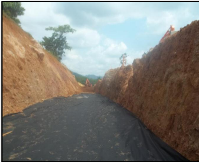
K 98 + 660 INSTALACION DE GEOTEXTIL CORREDOR VIAL SAN JOSE DEL FRAGUA - VILLAGARZÓN