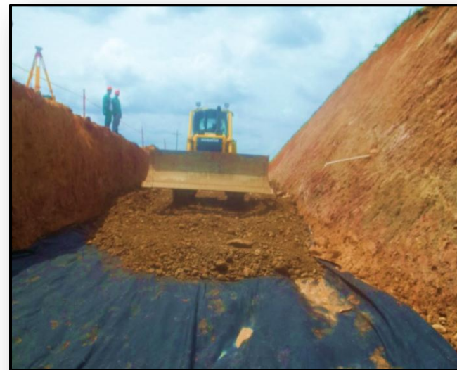
K 98 + 640 INSTALACION DE GEOTEXTIL CORREDOR VIAL SAN JOSE DEL FRAGUA - VILLAGARZÓN