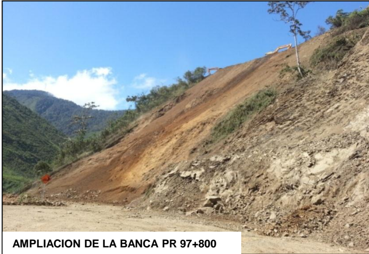
AMPLIACION DE LA BANCA PR 97+800