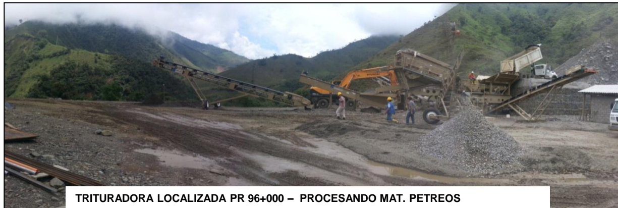
TRITURADORA LOCALIZADA PR 96+000 – PROCESANDO MAT. PETREOS