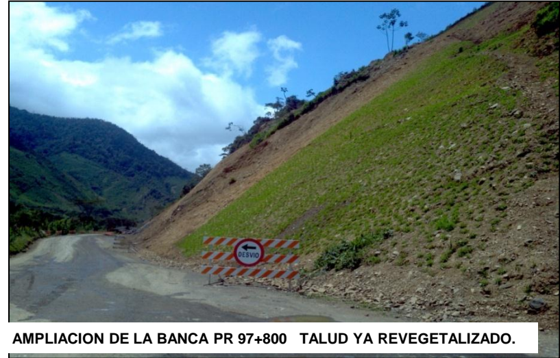
AMPLIACION DE LA BANCA PR 97+800 TALUD YA REVEGETALIZADO.