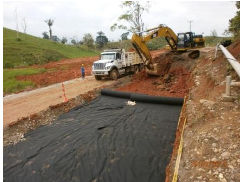
Explanación en k99+680 – k99+787 margen izquierda