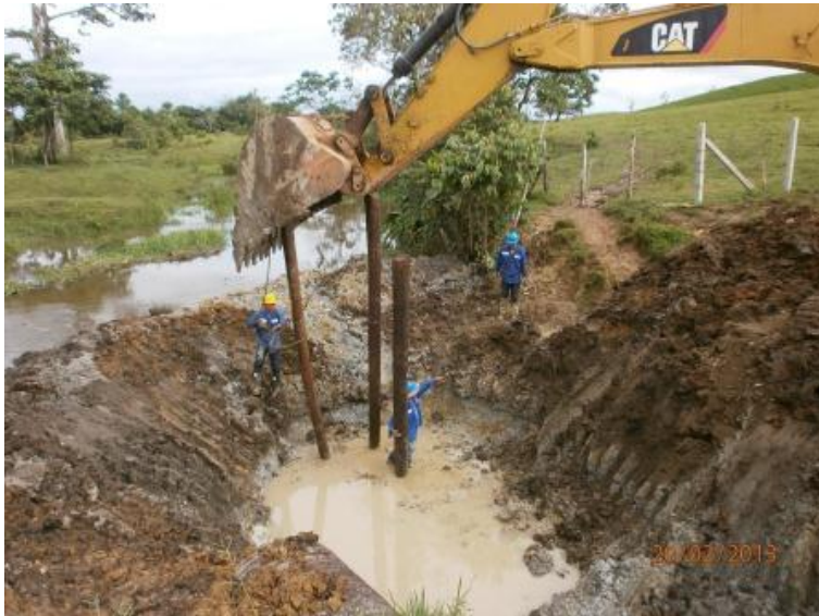
Hincada de pilotes en K99+972 – K99+987