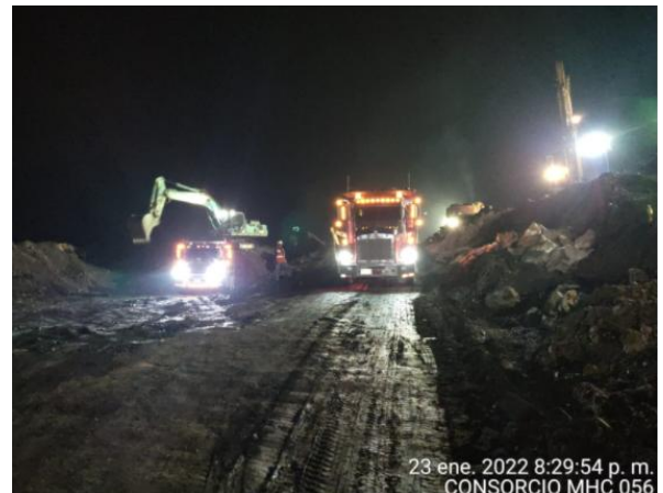
23 ene. 2022 8:29:54 p. m. CONSORCIO MHC 056

PR87+0000 Caída de banca Vía Sogamoso – Aguazul 24 de enero de 2022