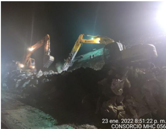
23 ene. 2022 8:51:22 p. m. CONSORCIO MHC 056

Monitoreo: CDGRD, CMGRD, Bomberos y Policía de Pajarito, Contratista Consorcio Vial MHC 056, Interventoría Consorcio Terra CGS