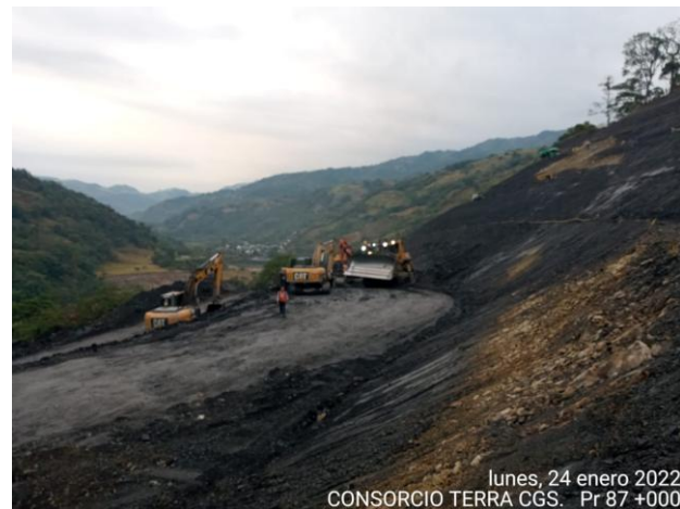
lunes, 24 enero 2022 CONSORCIO TERRA CGS. Pr 87 +000