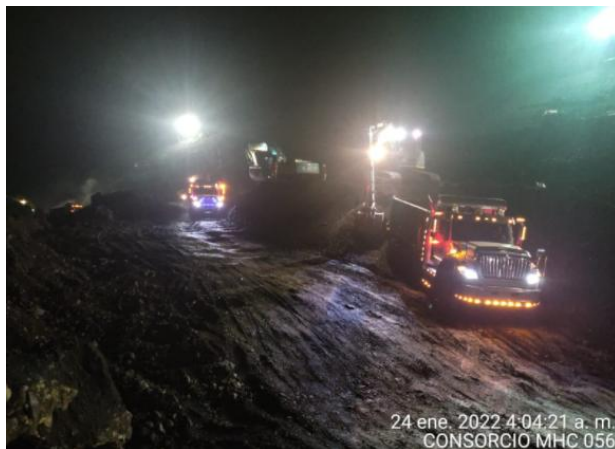
24 ene. 2022 4:04:21 a. m. CONSORCIO MHC 056