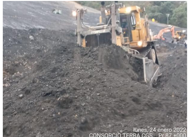
lunes, 24 enero 2022 CONSORCIO TERRA CGS. Pr 87 +000

PR87+0000 Caída de banca Vía Sogamoso – Aguazul 24 de enero de 2022