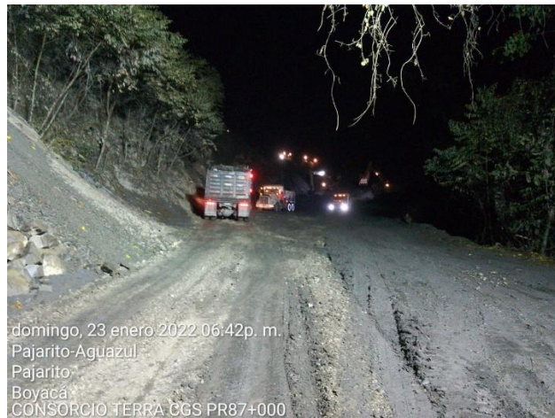
domingo, 23 enero 2022 06:42p. m. Pajarito-Aguazul Pajarito Boyacá CONSORCIO TERRA CGS PR87+000