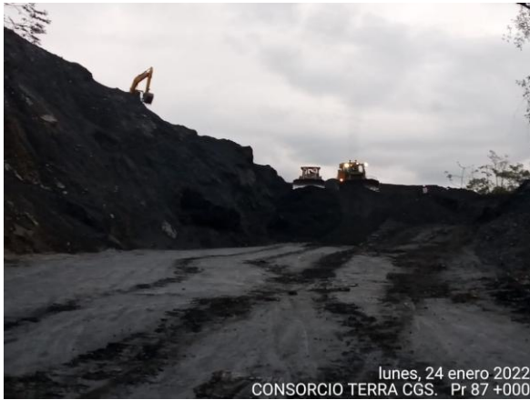
lunes, 24 enero 2022 CONSORCIO TERRA CGS. Pr 87 +000