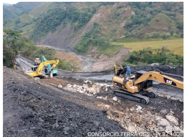
lunes, 24 enero 2022 CONSORCIO TERRA CGS. Pr 87 +000