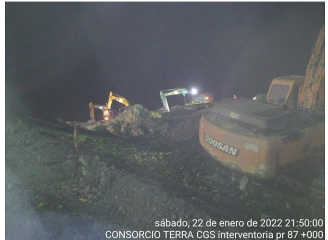
sábado, 22 de enero de 2022 21:50:00 CONSORCIO TERRA CGS interventoria pr 87 +000