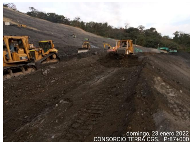
domingo, 23 enero 2022 CONSORCIO TERRA CGS. Pr87+000

PR87+0000 Caída de banca Vía Sogamoso – Aguazul 23 de enero de 2022