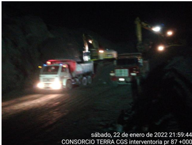
sábado, 22 de enero de 2022 21:59:44 CONSORCIO TERRA CGS interventoria pr 87 +000