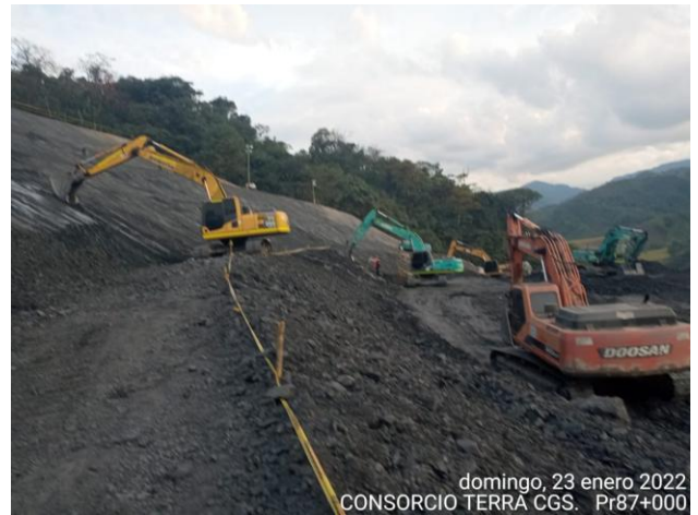
domingo, 23 enero 2022 CONSORCIO TERRA CGS. Pr87+000