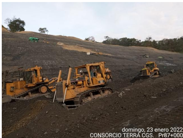
domingo, 23 enero 2022 CONSORCIO TERRA CGS. Pr87+000