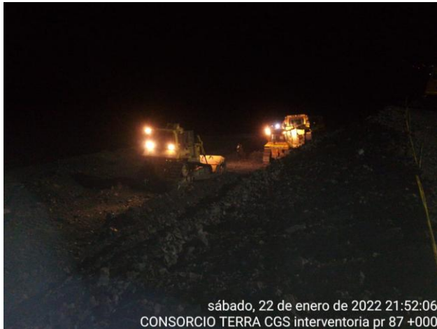
sábado, 22 de enero de 2022 21:52:06 CONSORCIO TERRA CGS interventoria pr 87 +000