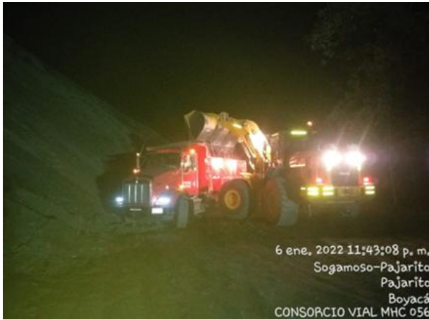
6 ene. 2022 11:43:08 p. m. Sogamoso-Pajarito Pajarito Boyacá CONSORCIO VIAL MHC 056