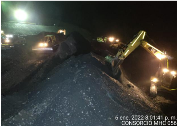
6 ene. 2022 8:01:41 p. m. CONSORCIO MHC 056