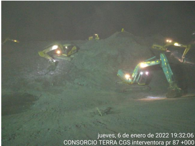
jueves, 6 de enero de 2022 19:32:06 CONSORCIO TERRA CGS interventora pr 87 +000