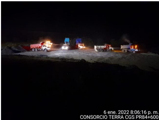
6 ene. 2022 8:06:16 p. m. CONSORCIO TERRA CGS PR84+600