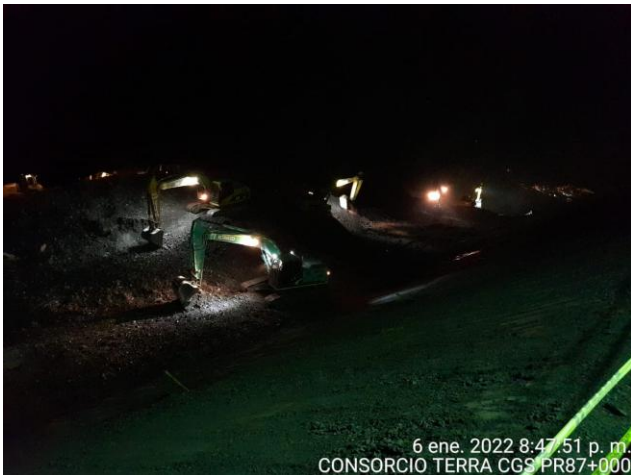
6 ene. 2022 8:47:51 p. m. CONSORCIO TERRA CGS PR87+000