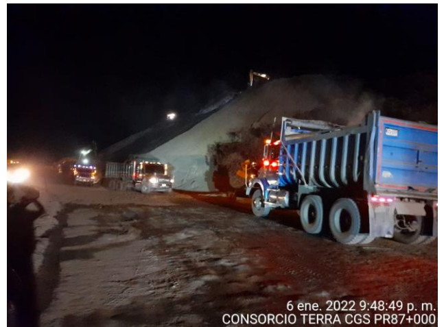
6 ene. 2022 9:48:49 p. m. CONSORCIO TERRA CGS PR87+000