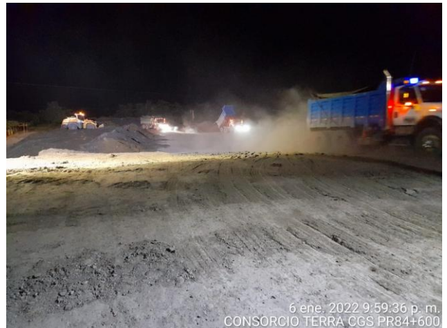
6 ene. 2022 9:59:36 p. m. CONSORCIO TERRA CGS PR84+600