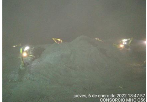
jueves, 6 de enero de 2022 18:47:57 CONSORCIO MHC 056