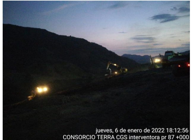
jueves, 6 de enero de 2022 18:12:56 CONSORCIO TERRA CGS interventora pr 87 +000