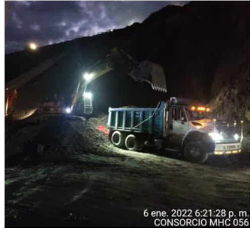
6 ene. 2022 6:21:28 p. m. CONSORCIO MHC 056

PR87+0000 Caída de banca Vía Sogamoso – Aguazul 07 de enero de 2022