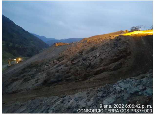
9 ene. 2022 6:06:42 p. m. CONSORCIO TERRA CGS PR87+000