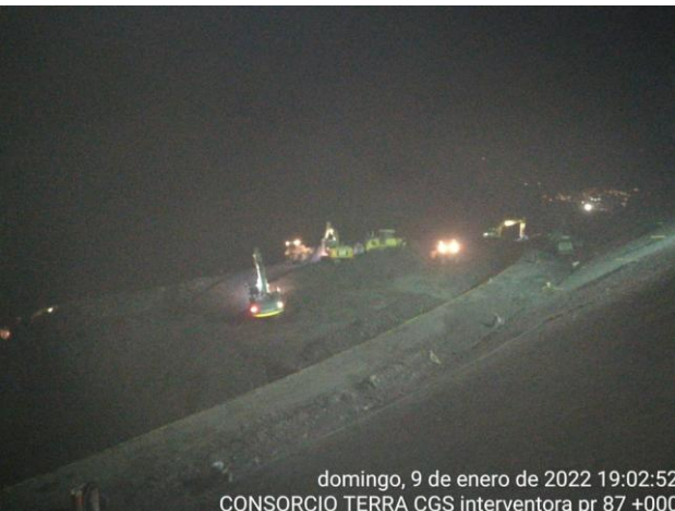
domingo, 9 de enero de 2022 19:02:52 CONSORCIO TERRA CGS interventora pr 87 +000