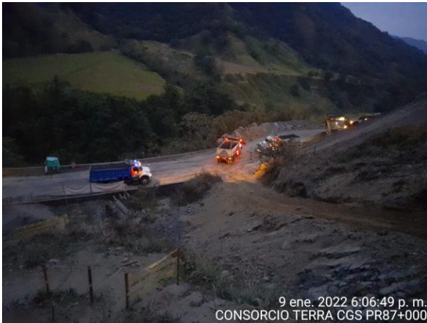
9 ene. 2022 6:06:49 p. m. CONSORCIO TERRA CGS PR87+000