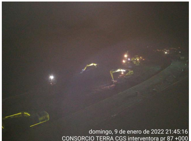
domingo, 9 de enero de 2022 21:45:16 CONSORCIO TERRA CGS interventora pr 87 +000