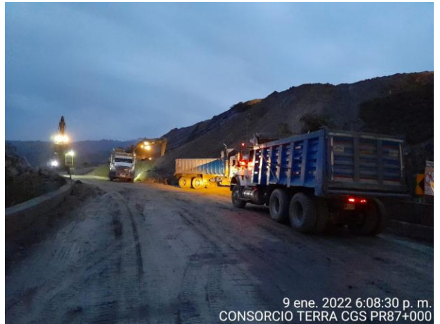
9 ene. 2022 6:08:30 p. m. CONSORCIO TERRA CGS PR87+000