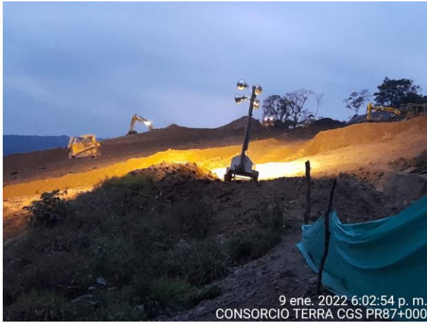
9 ene. 2022 6:02:54 p. m. CONSORCIO TERRA CGS PR87+000