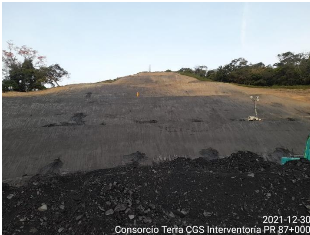
2021-12-30 Consorcio Terra CGS Interventoría PR 87+000