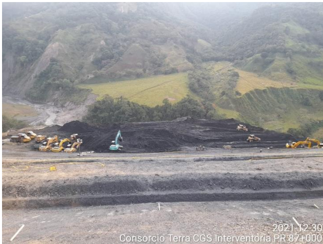
2021-12-30 Consortio Terra CGS Interventoria PR 87+000