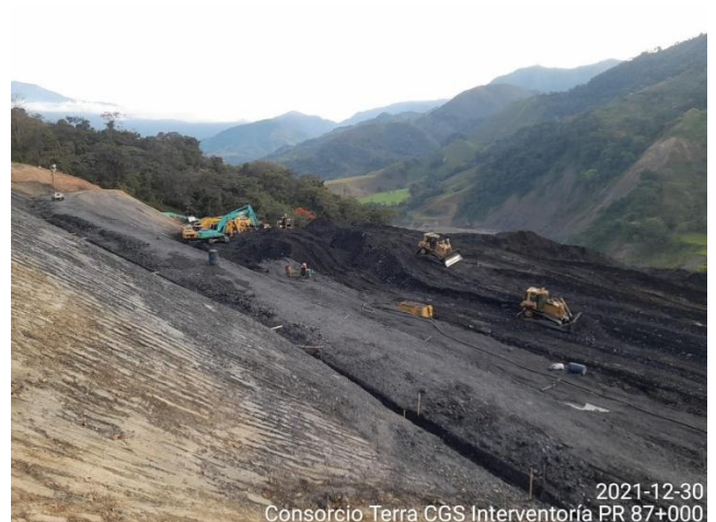
2021-12-30 Consortio Terra CGS Interventoria PR 87+000