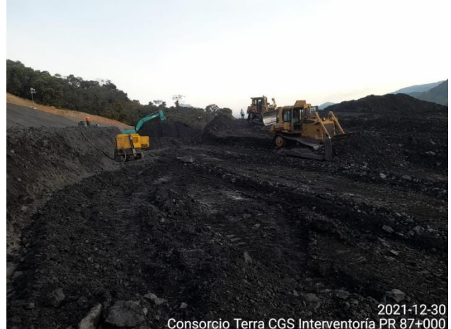
2021-12-30 Consorcio Terra CGS Interventoría PR 87+000