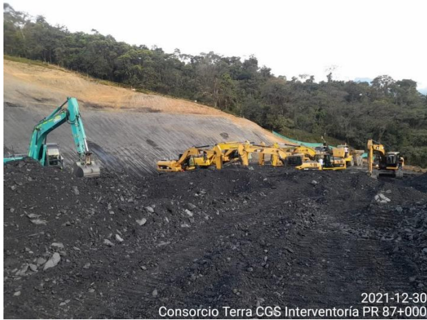
2021-12-30 Consorcio Terra CGS Interventoría PR 87+000