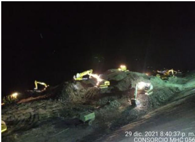
29 dic. 2021 8:40:37 p. m. CONSORCIO MHC 056