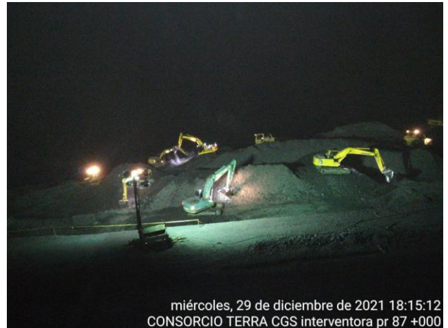
miércoles, 29 de diciembre de 2021 18:15:12 CONSORCIO TERRA CGS interventora pr 87 +000