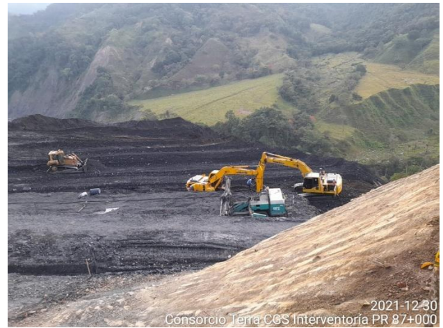
2021-12-30 Consorcio Terra CGS Interventoría PR 87+000

PR87+000 Caída de banca Vía Sogamoso – Aguazul 30 de diciembre de 2021