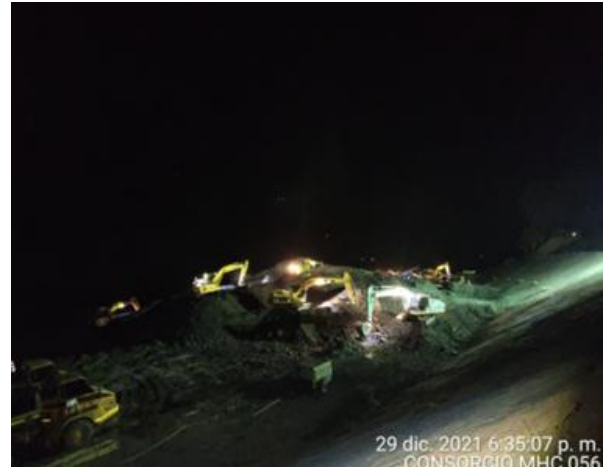
29 dic. 2021 6:35:07 p. m. CONSORCIO MHC 056