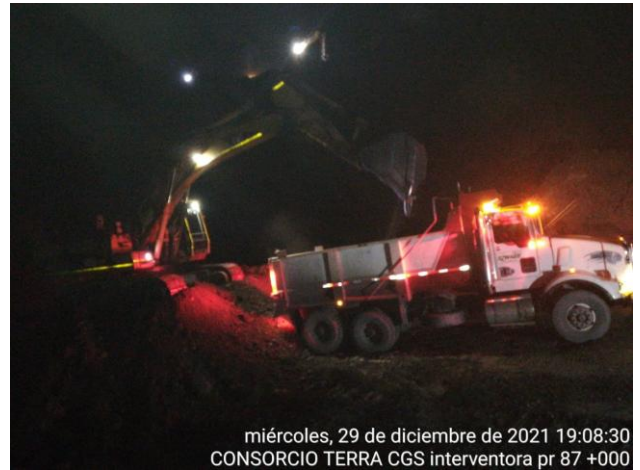
miércoles, 29 de diciembre de 2021 19:08:30 CONSORCIO TERRA CGS interventora pr 87 +000