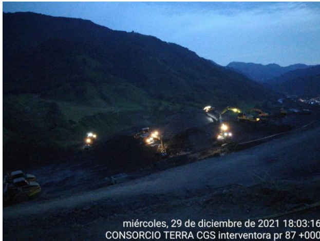
miércoles, 29 de diciembre de 2021 18:03:16 CONSORCIO TERRA CGS interventora pr 87 +000