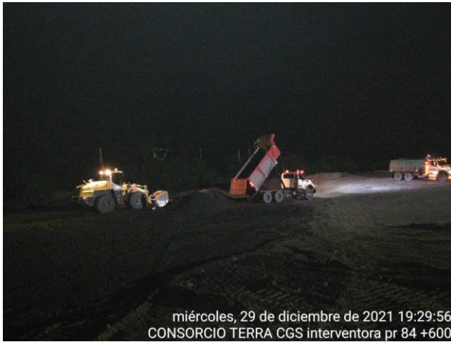
miércoles, 29 de diciembre de 2021 19:29:56 CONSORCIO TERRA CGS interventora pr 84 +600