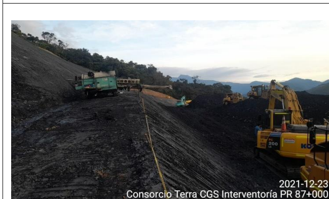
2021-12-23 Consorcio Terra CGS Interventoría PR 87+000