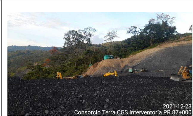
2021-12-23 Consorcio Terra CGS Interventoría PR 87+000