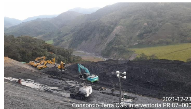
2021-12-23 Consorcio Terra CGS Interventoría PR 87+000

PR87+0000 Caída de banca Vía Sogamoso – Aguazul