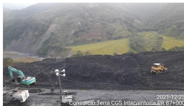
2021-12-23 Consorcio Terra CGS Interventoría PR 87+000