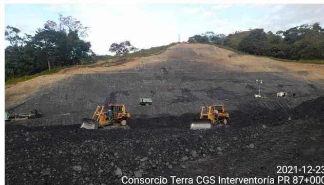
2021-12-23 Consorcio Terra CGS Interventoría PR 87+000