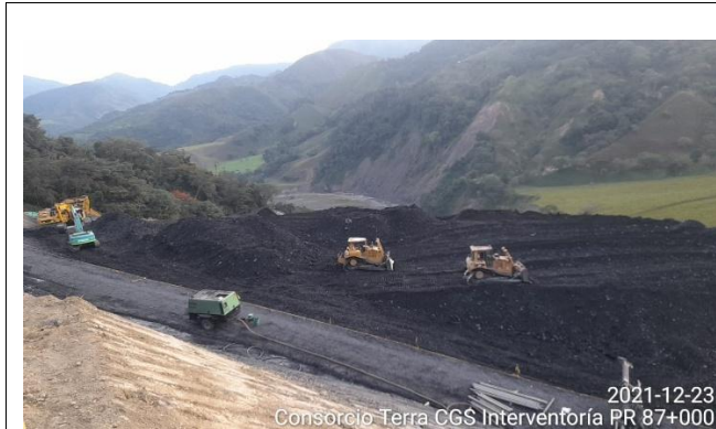
2021-12-23 Consorcio Terra CGS Interventoría PR 87+000