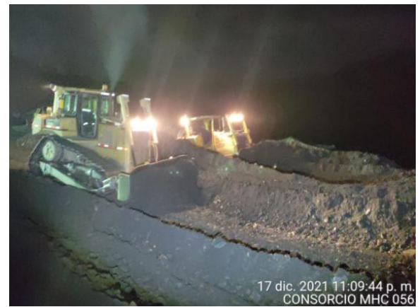
17 dic. 2021 11:09:44 p. m. CONSORCIO MHC 056