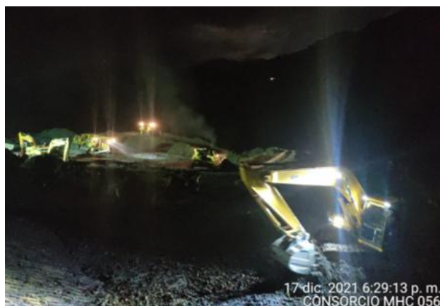
17 dic. 2021 6:29:13 p. m. CONSORCIO MHC 056