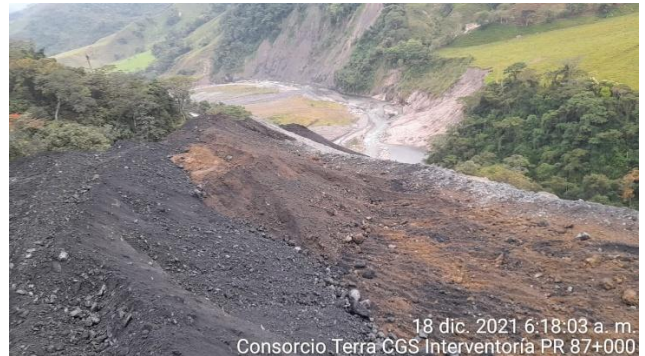
18 dic. 2021 6:18:03 a. m. Consorcio Terra CGS Interventoría PR 87+000