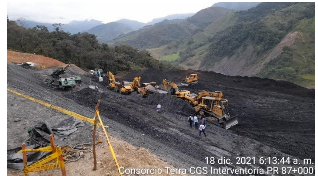
18 dic. 2021 6:13:44 a. m. Consorcio Terra CGS Interventoría PR 87+000

PR87+0000 Caída de banca Vía Sogamoso – Aguazul 18 de diciembre de 2021