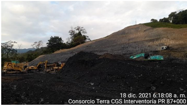
18 dic. 2021 6:18:08 a. m. Consorcio Terra CGS Interventoría PR 87+000