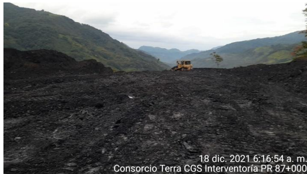
18 dic. 2021 6:16:54 a. m. Consorcio Terra CGS Interventoría PR 87+000