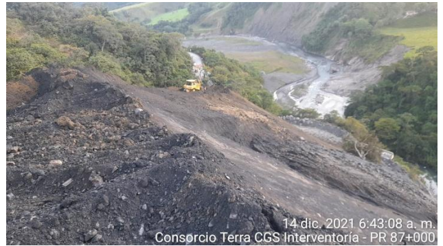
14 dic. 2021 6:43:08 a. m. Consorcio Terra CGS Interventoría - PR 87+000