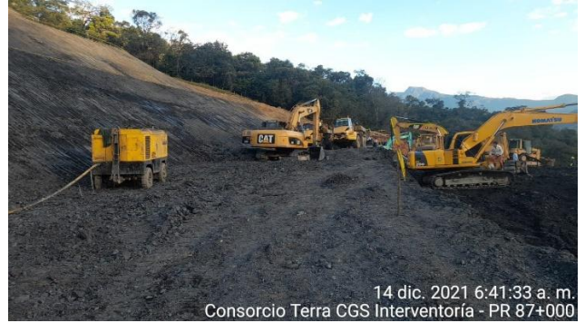
14 dic. 2021 6:41:33 a. m. Consorcio Terra CGS Interventoría - PR 87+000