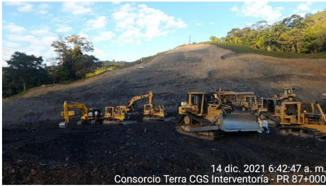
14 dic. 2021 6:42:47 a. m. Consorcio Terra CGS Interventoría - PR 87+000