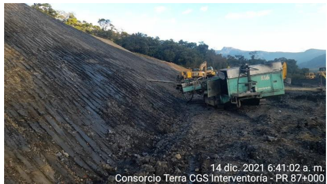
14 dic. 2021 6:41:02 a. m. Consorcio Terra CGS Interventoría - PR 87+000