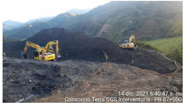
14 dic. 2021 6:40:47 a. m. Consorcio Terra CGS Interventoría - PR 87+000

PR87+0000 Caída de banca Vía Sogamoso – Aguazul