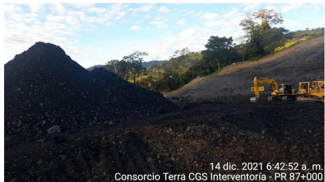
14 dic. 2021 6:42:52 a. m. Consorcio Terra CGS Interventoría - PR 87+000